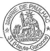
Nathalie RAOUX Maire de Paulhac

Madame le Maire informe que la présente décision peut faire l'objet d'un recours pour excès de pouvoir devant le Tribunal Administratif de Toulouse dans un délai de 2 mois, à compter de la présente publication par courrier postal (68 rue Raymond IV, BP 7007, 31068 Toulouse Cedex 7 ; Téléphone : 05 62 73 57 57 ; Fax : 05 62 73 57 40) ou par le biais de l'application informatique Télérecours, accessible par le lien suivant : http://www.telerecours.fr